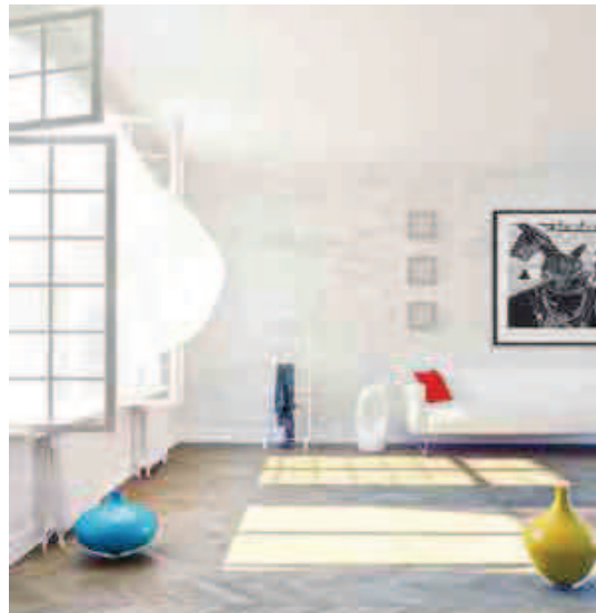
Nowoczesność jodełki francuskiej od firmy KACZKAN przejawia się w parametrach technicznych tego parkietu.